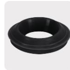
Empaque antifuga con diseño cónico