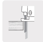
Longitud de carrera