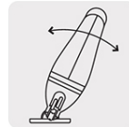
Cortes a 0°, 15°, 30° y 45° por ambos lados