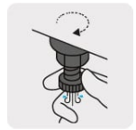
Válvula de drenado