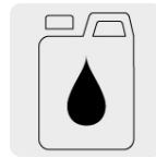
Incluye un bote de 250 ml de aceite monogrado SAE30