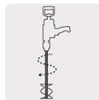
Compatible con revolvedores de pintura