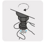
Válvula de drenado