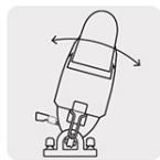
Capacidad de biselado 0 - 45° por ambos lados