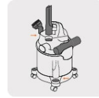
Almacenamiento de accesorios incorporado