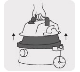
Asa de liberación rápida que facilita el vaciado