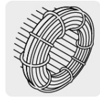
Motor con bobinas de cobre