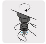
Válvula de drenado en la parte inferior del tanque